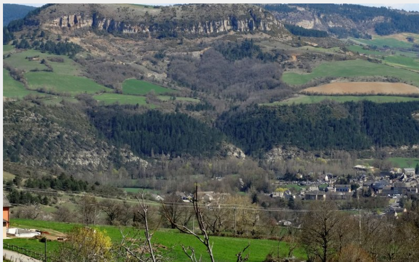
Le Truc de Saint-Bonnet