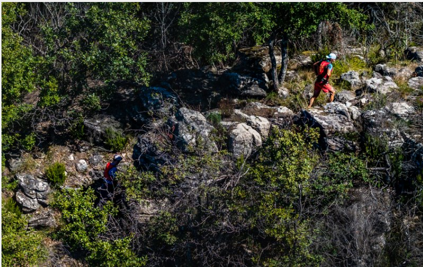
Montée de Dourbiette (Fest'Trail)