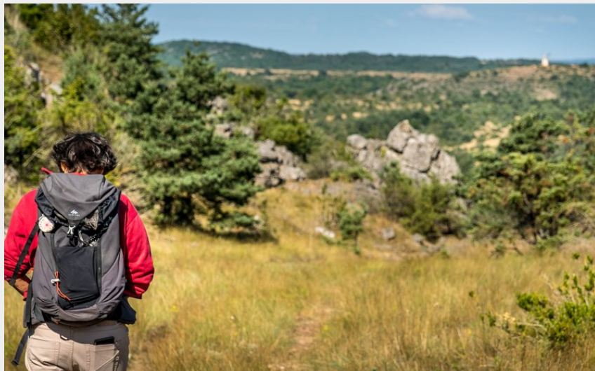
Le Larzac et le Moulin de La Couvertoirade