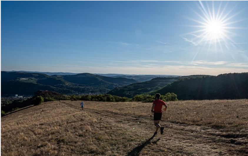
Crête de Caylus