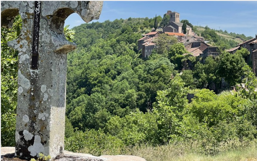
Croix du Serre (G Bertrand)