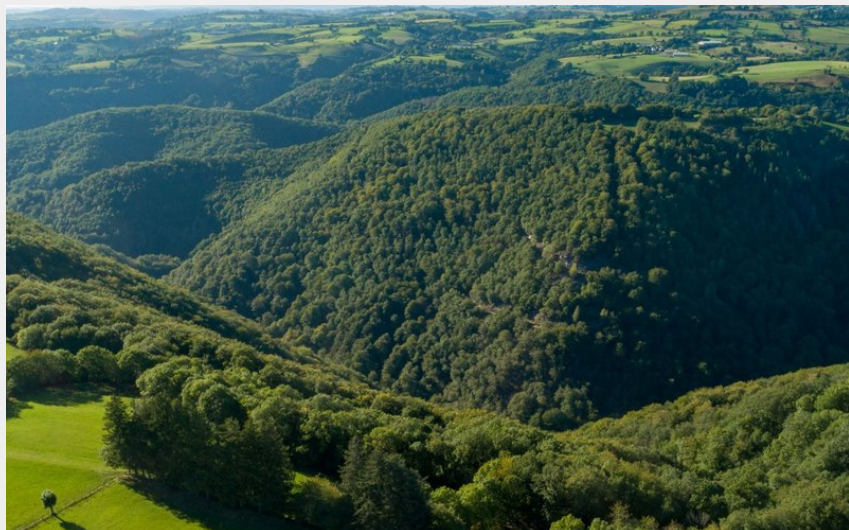
La boralde vue du ciel