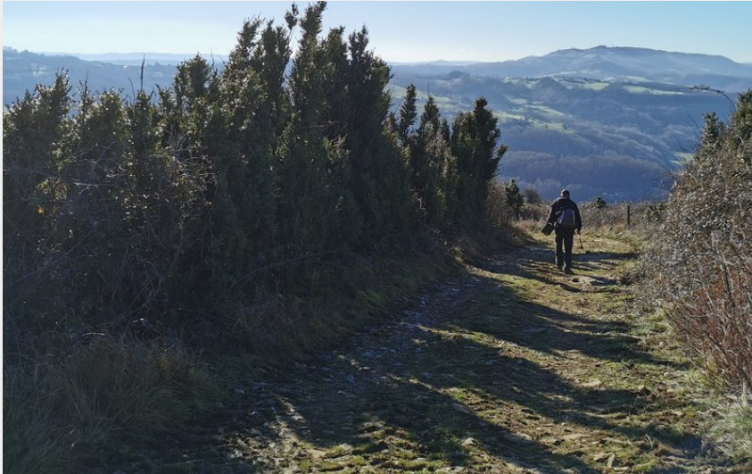
Descente sur Mandailles-vue sur le Lot