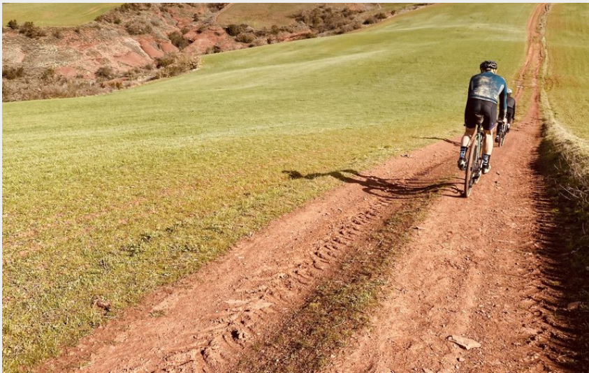
Gravel dans les chemins du rougier (PNR)