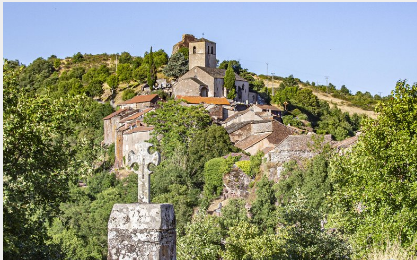
Sentier des Paredous