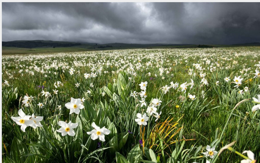
Champs de narcisses