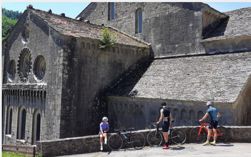
Abbaye de Sylvanès