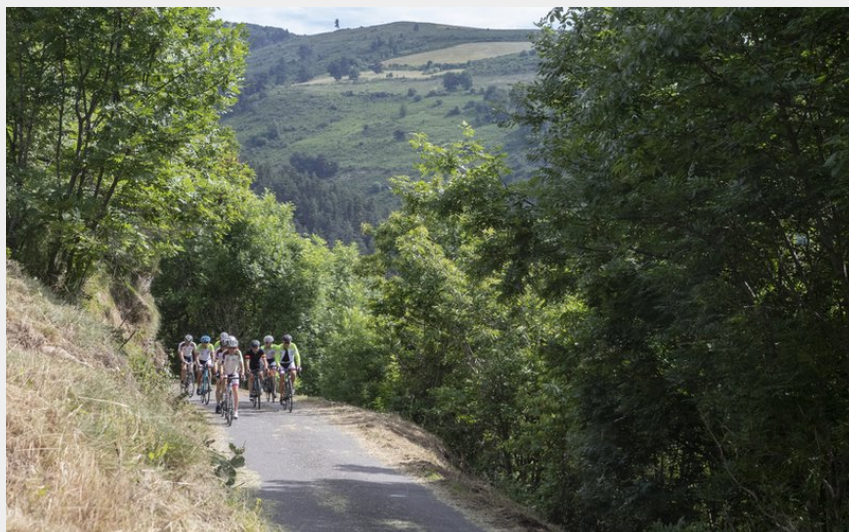
Sur la route