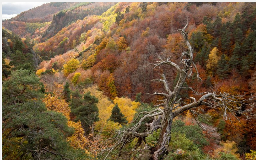
Les gorges de l'Enfer