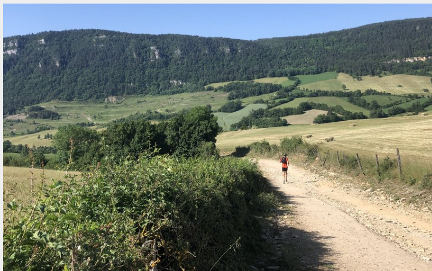
Piste en montant vers Fraissinet