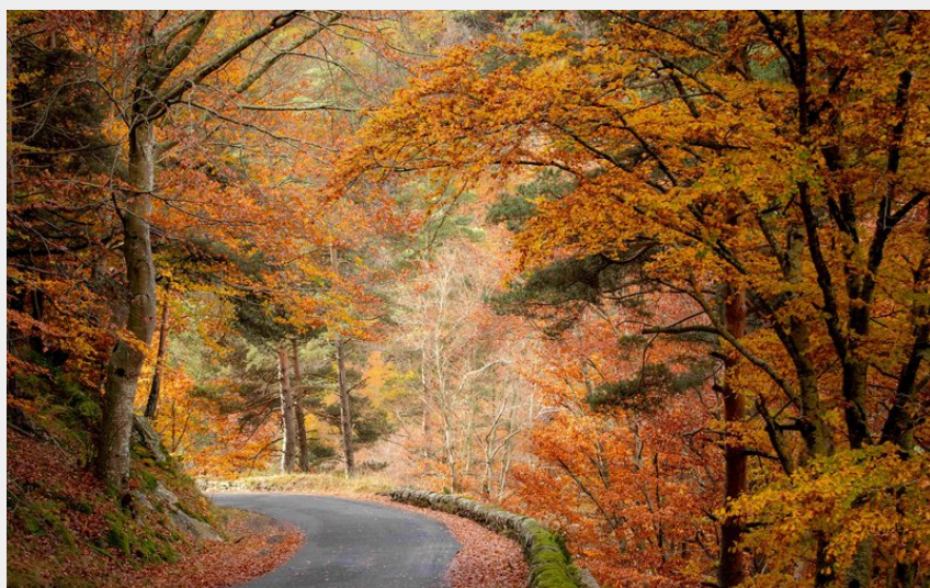
Les routes de la vallée de l'Enfer