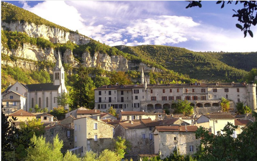
Village de Creissels (OT Millau GC)