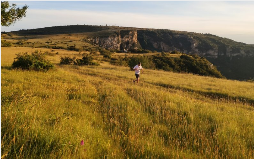
Les corniches du Boundoulaou (GBarrabe)