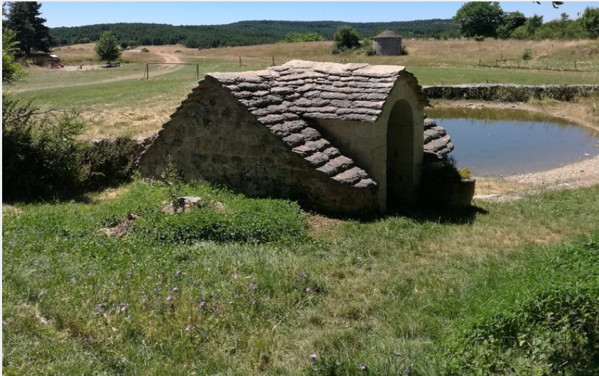
L'étang de Veyreau (GBarrabe)