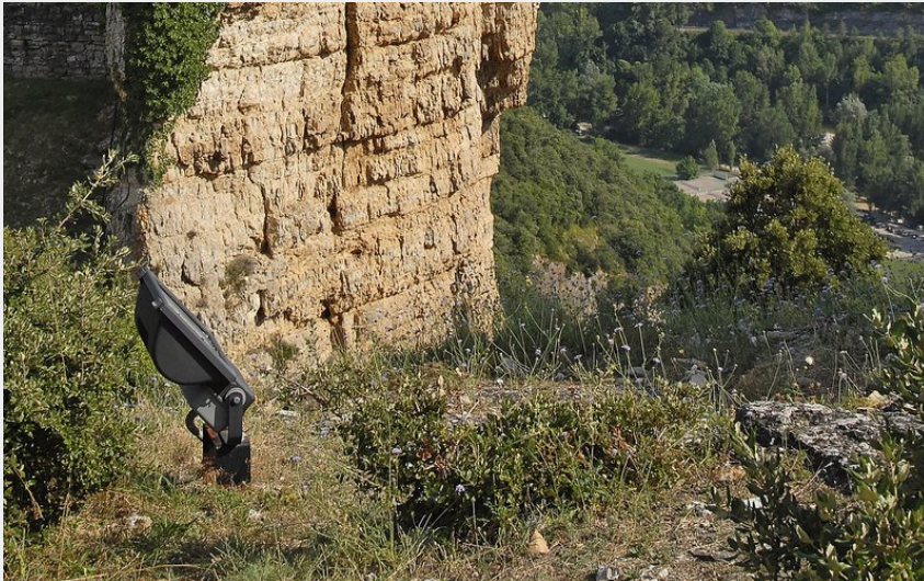
Le château de Peyrelade (Eric Teissedre)