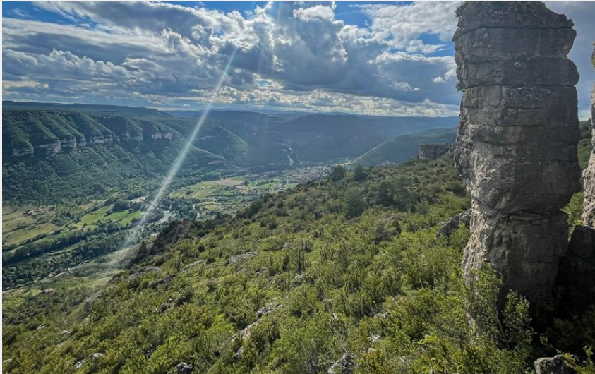
Fin de journée sur le Sauveterre (Festival des Templiers)