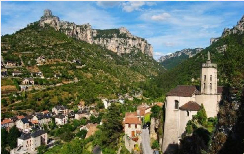
Rozier et ses falaises vues de Peyreleau (OT Millau GC)