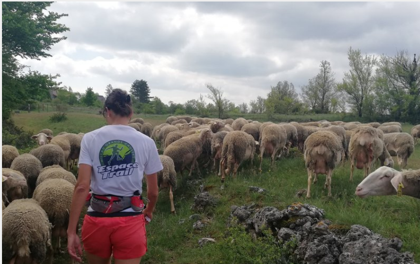
Entre buissières et pâturages (GBarrabe)