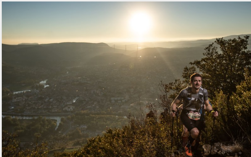
Un final...piquant (Festival des Templiers)