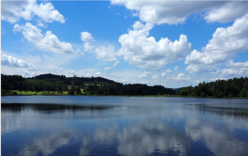
Lac du Moulinet