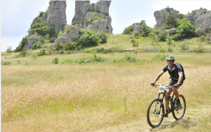
A coeur des chaos de Roquesaltes (La Caussearde)