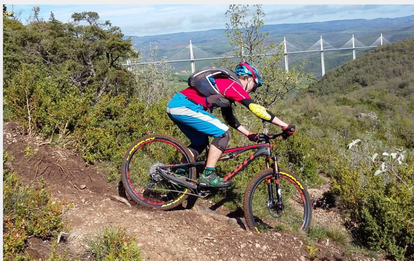
Le viaduc en toile de fond (Ealinat)