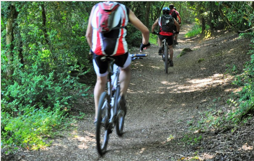
Dans les buissières du Larzac (La Causse narde)