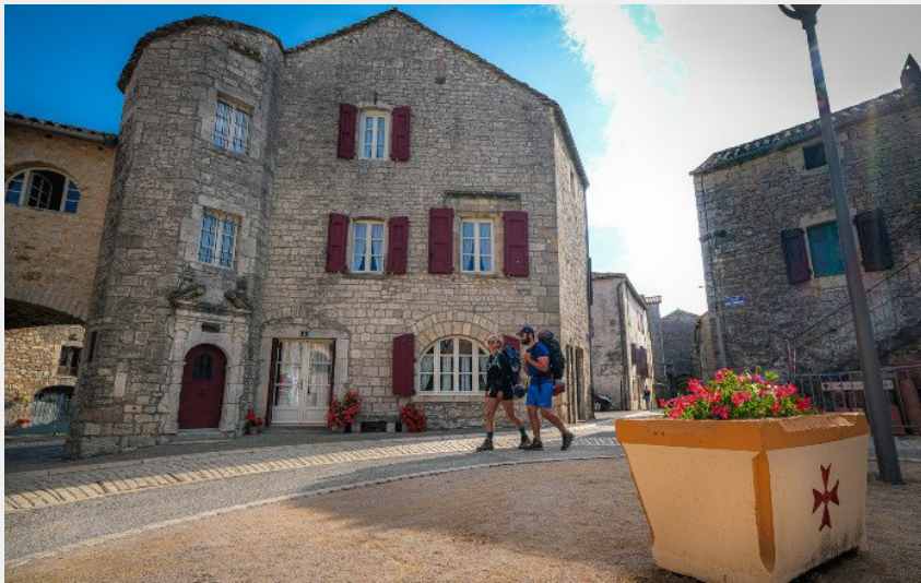
Dans les ruelles de la Cavalerie