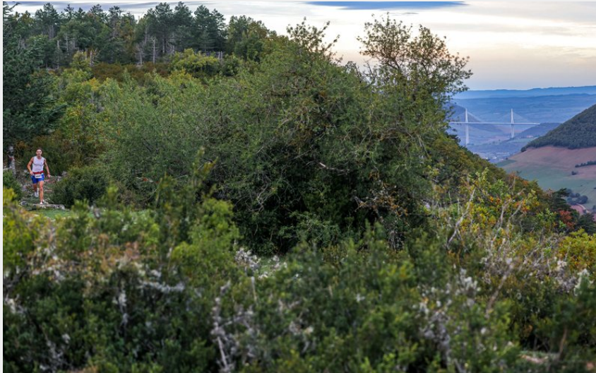
Causse Noir au dessus de Paulhe