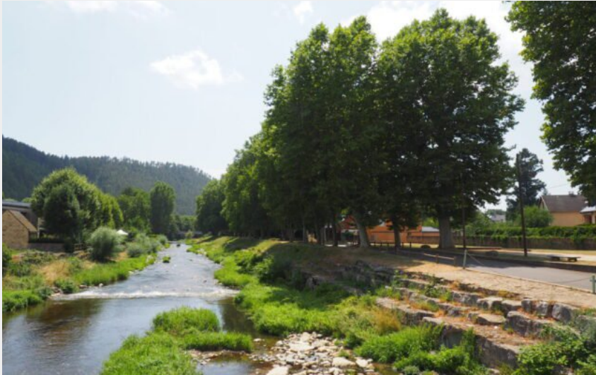
Les abords de la Colagne