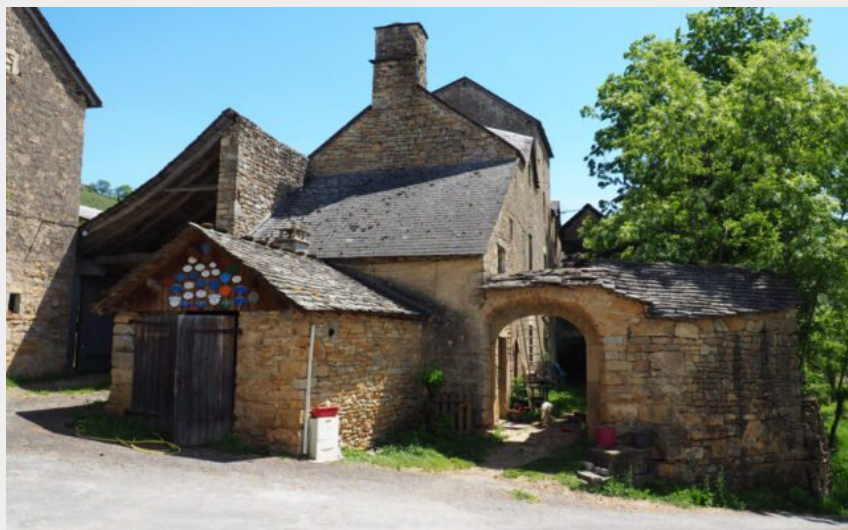
Un des hameaux sur le Truc de Saint-Bonnet