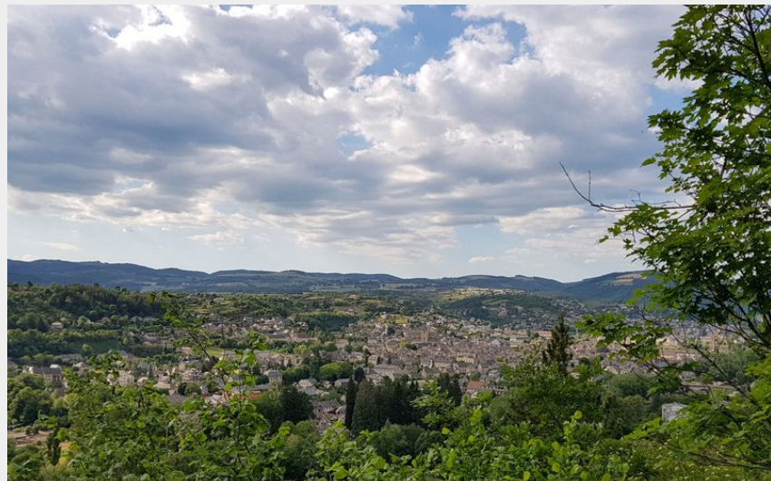
Vue de Marvejols