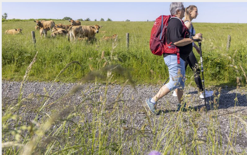
Croiser les belles Aubrac