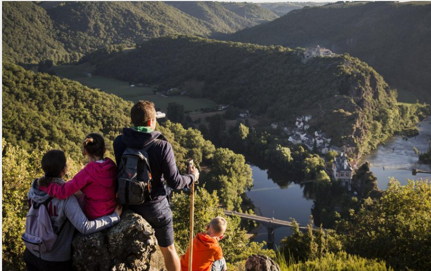
GR736 - Presqu'île d'Ambialet (CDT du Tarn)