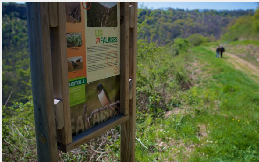
Panneau d'interprétation de la lande de Mayrinhac (Conseil Départemental de l'Aveyron)