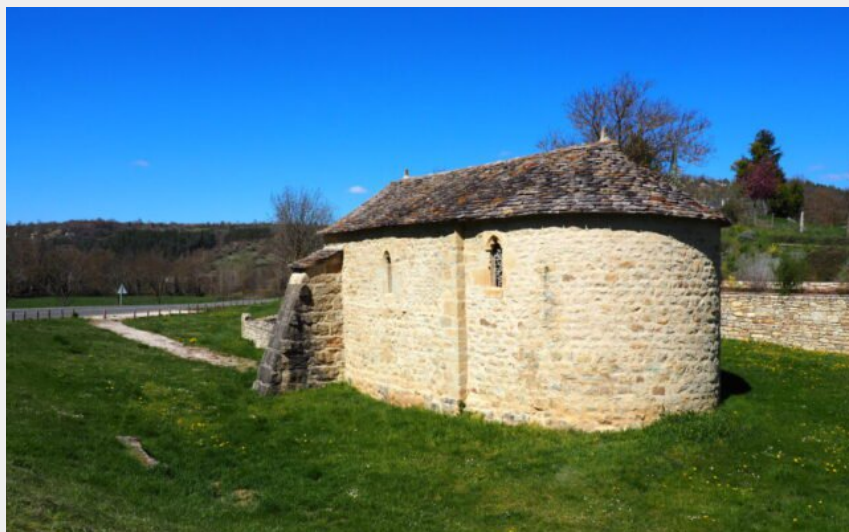
Le patrimoine bâti du Gévaudan