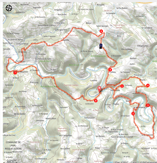
VTT Combret - ©Exo Dams

Technicité requise sur cette grande boucle qui serpente entre sentiers forestiers et lignes de crête et qui vous emmène au monastère Notre-Dame d'Orient au gré d'un jeu de piste patrimonial