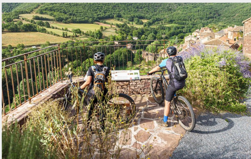
VTT Combret