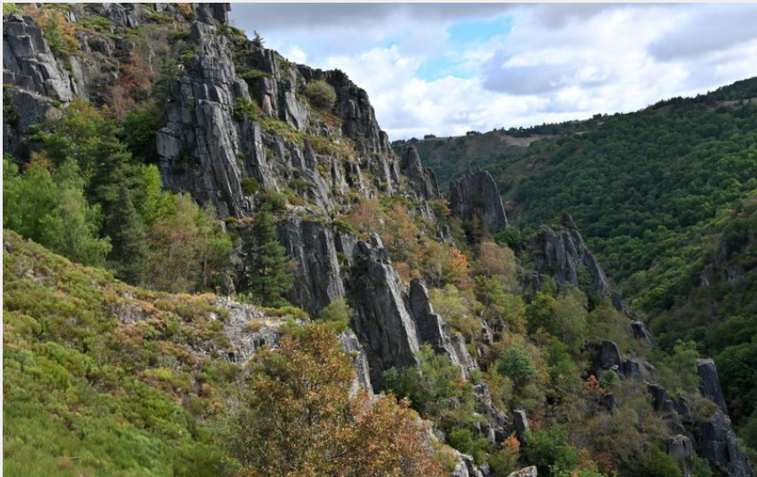
Les vertigineuses Gorges du Bès