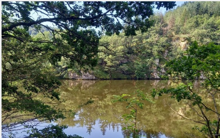
Vue sur le cours d'eau de la Truyère