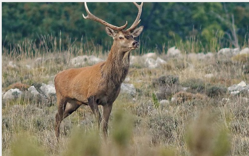
Un cerf surpris sur une crête