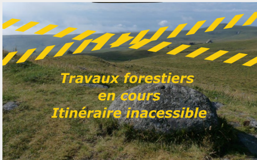
IMPRATICABLE, travaux forestiers en cours