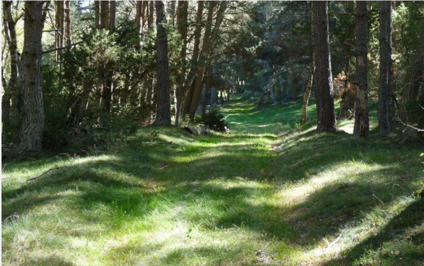
Un chemin forestiers très agréable (OT des Pays de Saint-Flour)