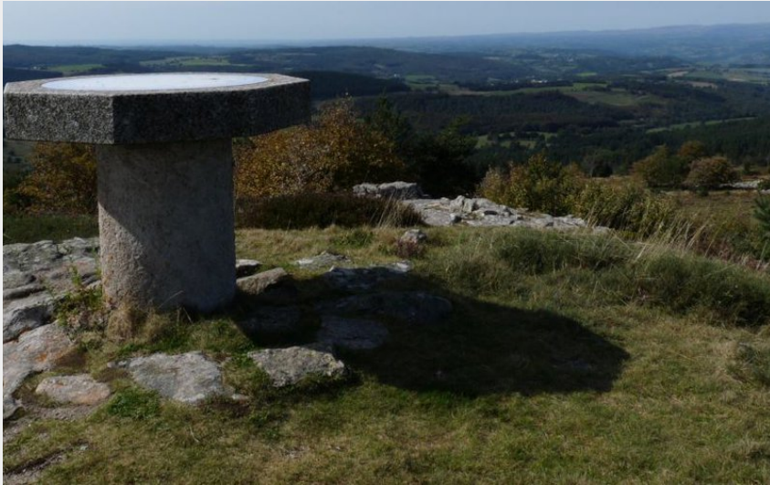
La table d'orientation au point culminant de la randonnée (OT des Pays de Saint-Flour)