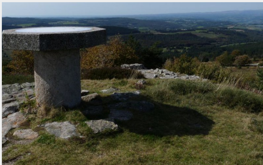
La table d'orientation au point culminant de la randonnée (OT des Pays de Saint-Flour)