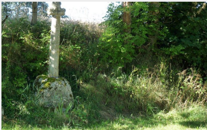
Une des nombreuses croix qui ponctuent le parcours (OT des Pays de Saint-Flour)