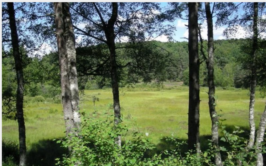
La tourbière de la Vergne des Mazes (OT des Pays de Saint-Flour)