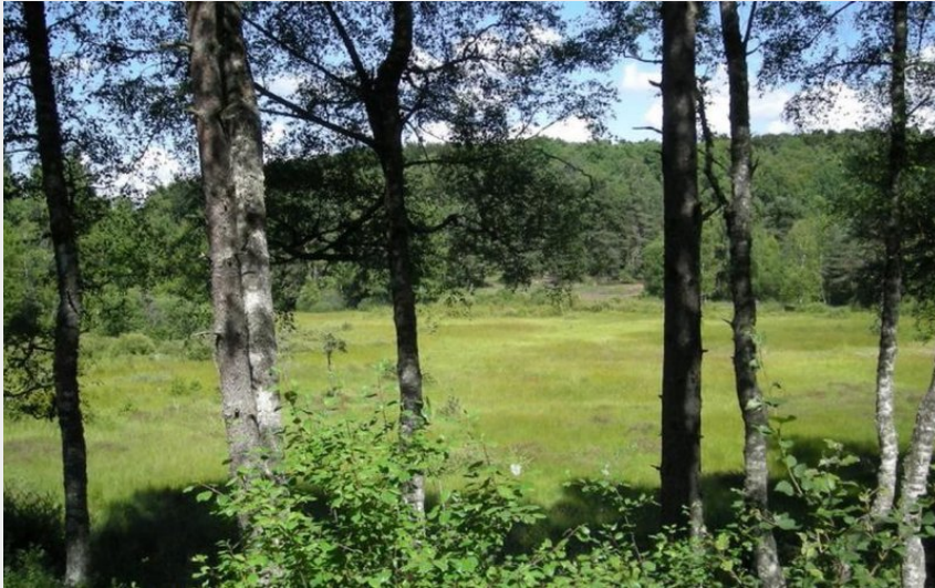
La tourbière de la Vergne des Mazes (OT des Pays de Saint-Flour)