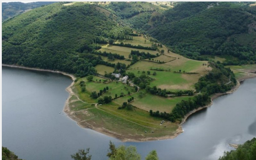
Le hameau de Laval sur la rive opposées du Bès (OT des Pays de Saint-Flour)