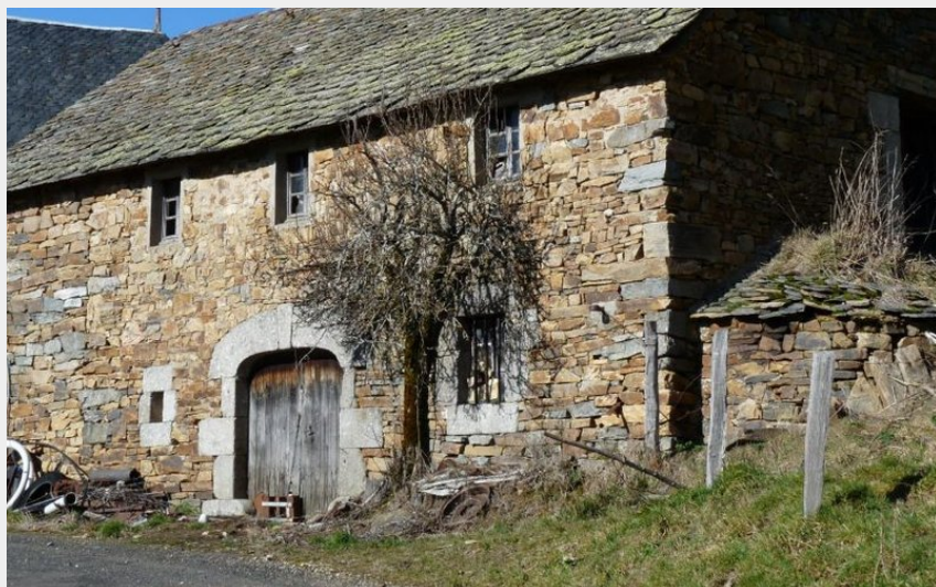
Une grange en très bon état (OT des Pays de Saint-Flour)