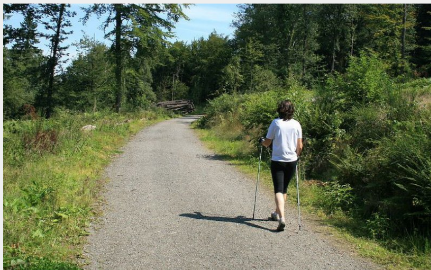
Les chemins forestiers pour accéder à la vallée du Bès