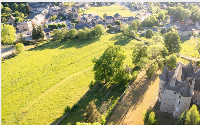
Le village de Fournels avec le château